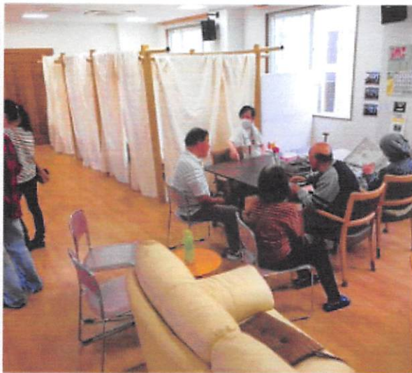
熊本地産の産品を販売する福祉避難所。避難スペースも設けられた熊本市で2016年の社会福祉法人「デルフト」ホーム運営

毎日新聞は、台風19号による避難者が多かった福島、宮城、長野の3県の自治体に対し、福祉避難所を設けたかどうかを確認した。3県の計177市町村のうち55市町村が開設し、うち24市町村は防